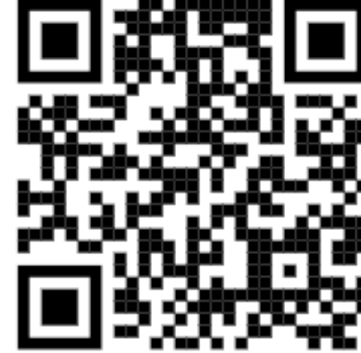
نموذج اتفاقية التطوع