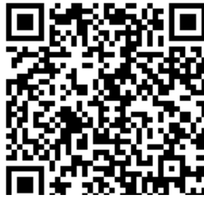
نموذج إتمام مهمة